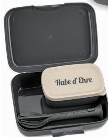
Innenansicht Candy Ready Beispiel Siebdruck auf Lunchbox Candy S

Farben (auf Lager) Sonderfarbe ab 500 Stück möglich