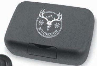
Beispiel Siebdruck auf Lunchbox Candy L

Angebot freibleibend, Preise zzgl. MwSt. ab Werk, Irrtümer vorbehalten. Bitte senden Sie uns Ihre druckfähigen PDF- oder EPS-Daten inklusive Pantone Farbangaben zu.