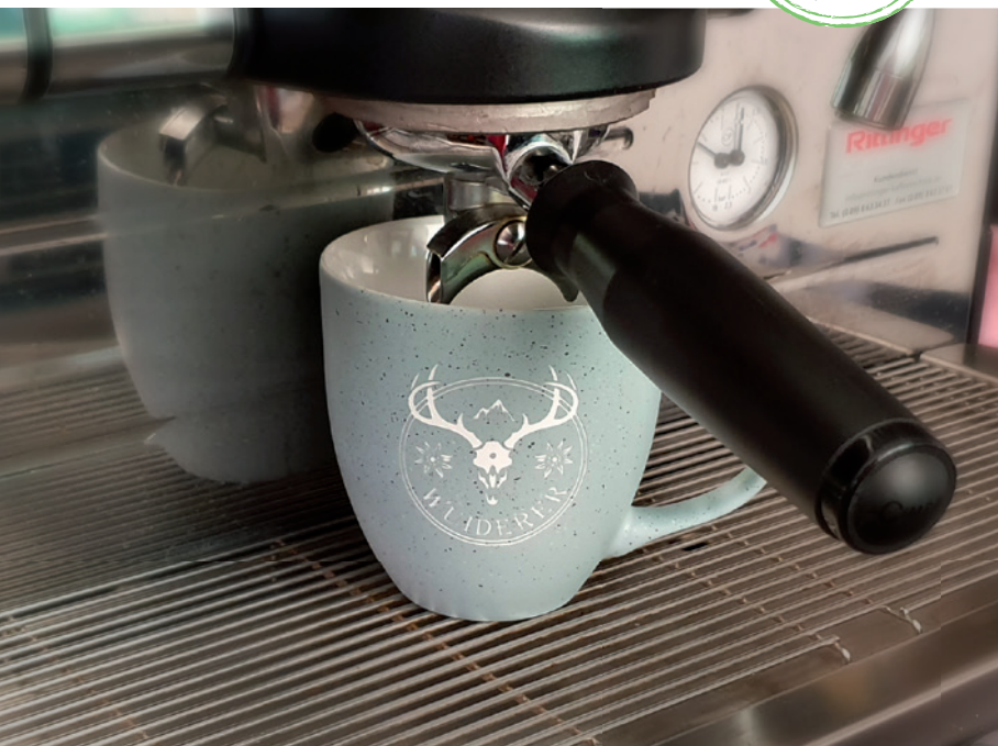
Jumbotasse Form 151 in Betonoptik, Beispiel individuelle Logogravur

Die Jumbotasse ist einer der Topseller überhaupt! Für Viel-Kaffeetrinker ist die Tasse ideal geeignet. Mit ihrer Füllmenge von 0,4 Liter können im Büroalltag auch längere Meetings angegangen werden. Die Hydroglasur sorgt für brillante, CI-gerechte Farben, durch die Gravur ergibt sich eine effektvolle, hochwertige Werbeanbringung.