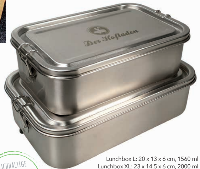
Lunchbox L: 20 x 13 x 6 cm, 1560 ml Lunchbox XL: 23 x 14,5 x 6 cm, 2000 ml