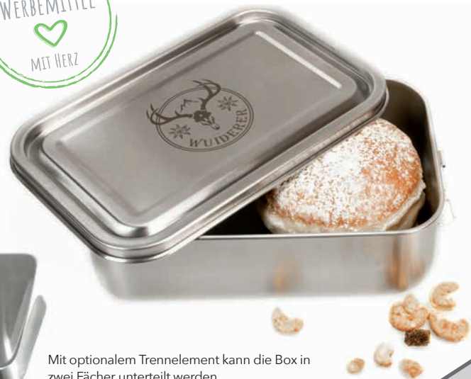
Mit optionalem Trennelement kann die Box in zwei Fächer unterteilt werden

Lieferzeit: ca. 2 Wochen nach Produktionsfreigabe | Fixtermin? Fragen Sie nach unserem Express-Service! Angebot freibleibend, Preise zzgl. MwSt. ab Werk, Irrtümer vorbehalten. Bitte senden Sie uns Ihre druckfähigen PDF- oder EPS-Daten inklusive Pantone Farbangaben zu.