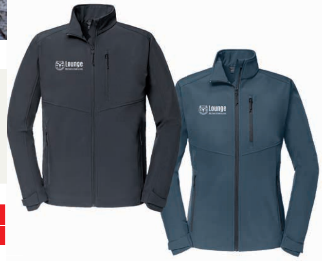
Beispiel 1-farbiger Aqua-Transferdruck