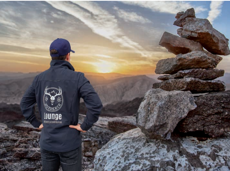
Softshelljacke EINSTEIGER, Beispiel Aqua-Transferdruck auf dem Rücken (Preis auf Anfrage)