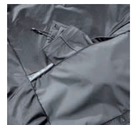
Abnehmbare Kapuze, Aufbewahrung in der Hood Pack Away Tasche

Lieferzeit: ca. 4-5 Wochen nach Produktionsfreigabe | Fixtermin? Fragen Sie nach unserem Express-Service!