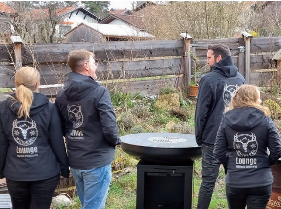
Softshelljacke JEDENTAG, Beispiel 1-farbiger Aqua-Transferdruck