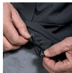
Rutschfester Jackensaum mit Verstellung