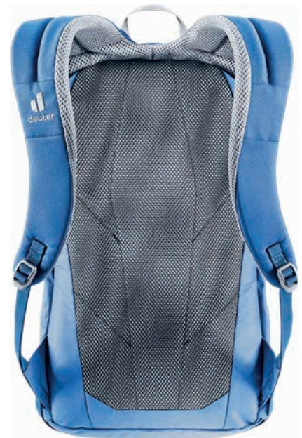
Urban Pack 16 DI mit Contact System mit Ventilationsschaum-Rücken

Urban Pack 16 DI mit einem Contact System mit Ventilationsschaumrücken. Bequemer Zugang zum Hauptfach durch den 2-Wege-Rundbogen-Reißverschluss, Reißverschluss-Vortasche mit abnehmbarem Schlüsselclip, elastische Seitentaschen, Dokumentenfach und Wertsachenfach. Für junge und trendbewusste Leute, die bei ihren Ausflügen stylish und leicht unterwegs sein möchten.