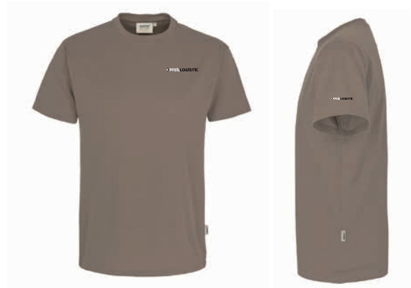
T-Shirt Mikralinar® Herren Beispiel Stick auf Brust und Schulter