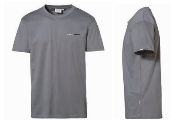
T-Shirt CLASSIC Herren Beispiel Stick auf Brust und Schulter