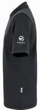
Poloshirt Mikralinar® ECO, Beispiel Transferdruck auf Brust und Schulter

Das strapazierfähige Marken-Poloshirt von Hakro ist hochwertig verarbeitet und besteht aus weichem, pflegeleichtem und funktionellem Piqué aus Baumwolle und zertifiziertem, recyceltem Polyester. Es ist in vielen verschiedenen Farben erhältlich, hat eine modische 3-Loch-Knopfleiste mit bruchsicheren Ton- in-Ton-Knöpfen. Die individuelle Werbeanbringung ist als Siebdruck, Transferdruck oder Stick möglich.