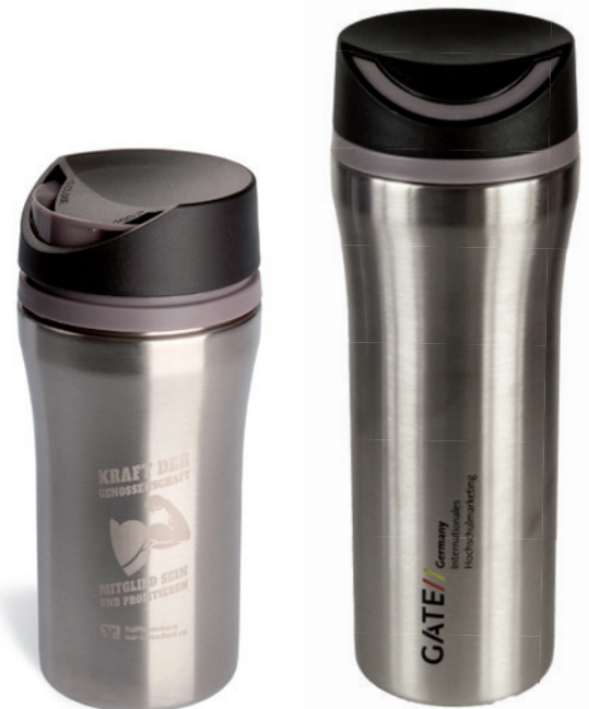
WINNIPEG (350 ml), Beispiel Lasergravur hell