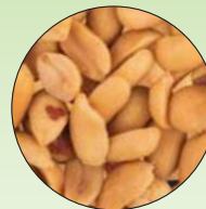
Erdnüsse geröstet und gesalzen