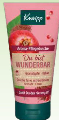
Granatapfel & Kakao