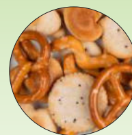
Brezel Knabber Mix