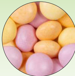
Mentos Fruit (Erdbeere, Orange und Zitrone)