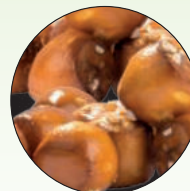
Brezelkugeln Honig und Senf