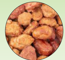
Süß gebrannte Mandeln und Erdnüsse