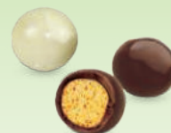
Black & White