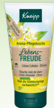
Litsea Cubeba & Zitrone