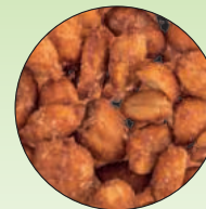
Erdnüsse mit Honig und Salz