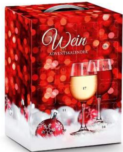
Hochkant, im weihnachtlich roten Dekor Maße: 44,5 x 30 x 22 cm