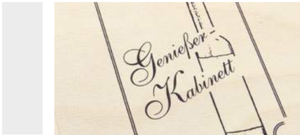
TAMPON- & SIEBDRUCK

Grundsätzlich gibt es viele verschiedene Druckmöglichkeiten. Wir wählen immer die beste Variante produktbezogen für Sie aus, um ein bestmögliches Druckergebnis zu erhalten. Schön wirken auch Aufkleber auf den Kartonagendeckeln – versehen mit Ihrem Logo und vielleicht einem Gruß an die Beschenkten. Hier stellen wir Ihnen gerne unsere Standardmotive als Basis zur Verfügung.