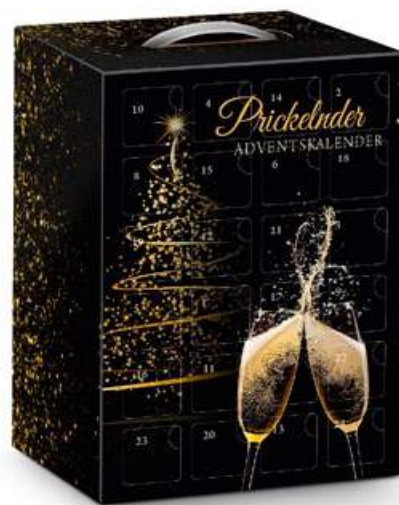
Hochkant, im schwarz-goldenen Dekor Maße: 44,5 x 30 x 22 cm