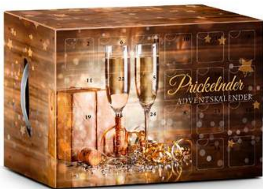
Quer, im gold-braunen Dekor Maße: 44,5 x 30 x 22 cm