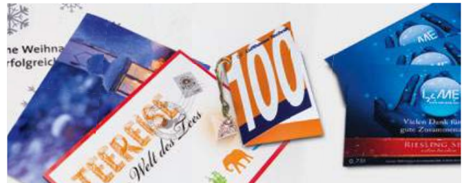
AUFKLEBER, ETIKETTEN UND ANHÄNGER – 4C