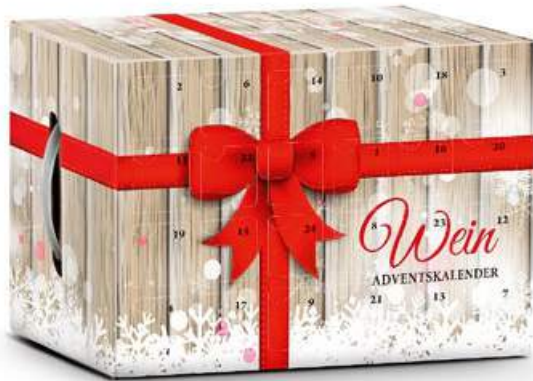
Quer, im winterlich-rustikalen Dekor Maße: 44,5 x 30 x 22 cm