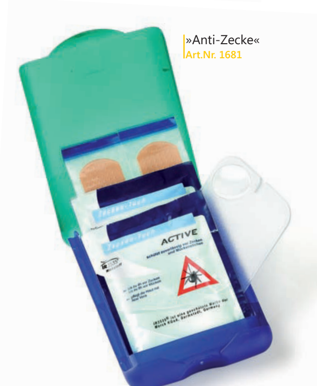
»Anti-Zecke« Art.Nr. 1681