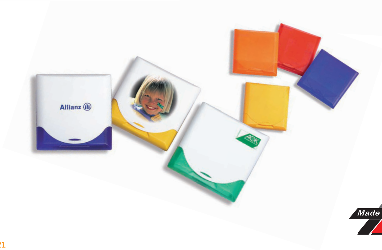
»First-Aid« Art.Nr. 1550