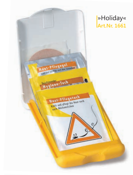
»Holiday« Art.Nr. 1661