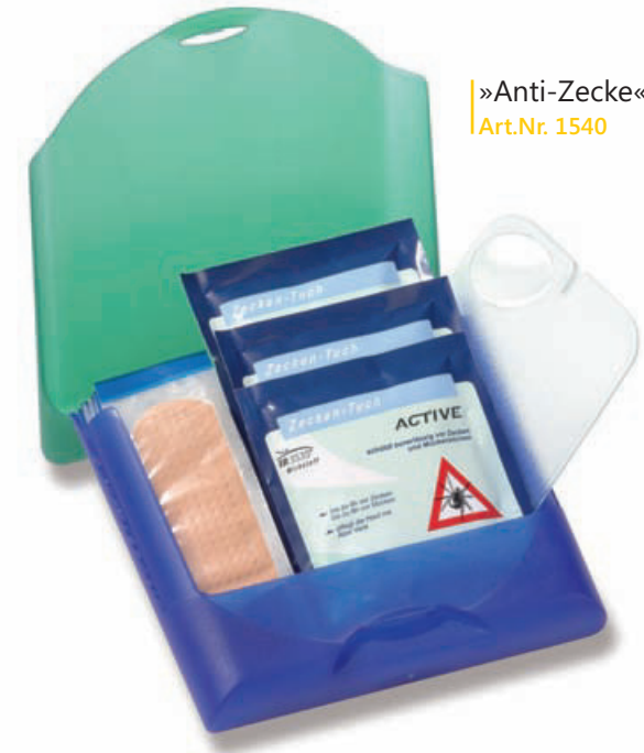
»Anti-Zecke« Art.Nr. 1540