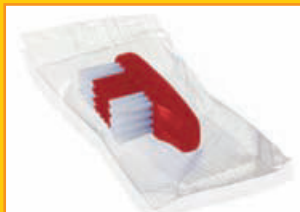
Bürstenkopf einzeln in Folie eingeschelt