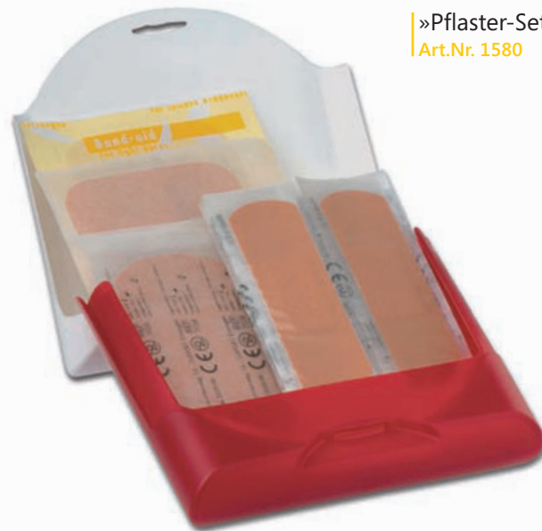
»Pflaster-Set« Art.Nr. 1580