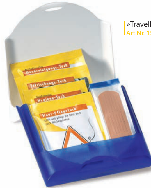
»Traveller« Art.Nr. 1560