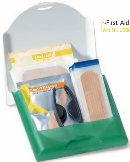
»First-Aid« Art.Nr. 1550