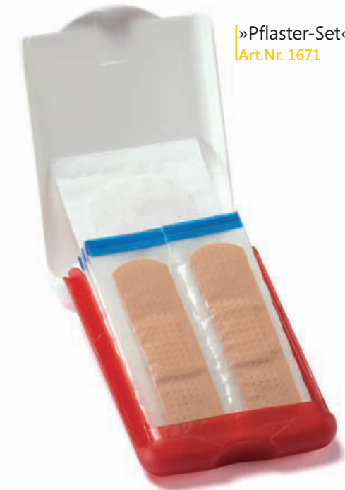
»Pflaster-Set« Art.Nr. 1671