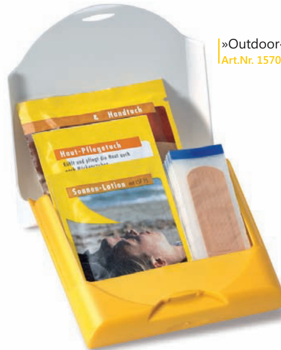
»Outdoor« Art.Nr. 1570