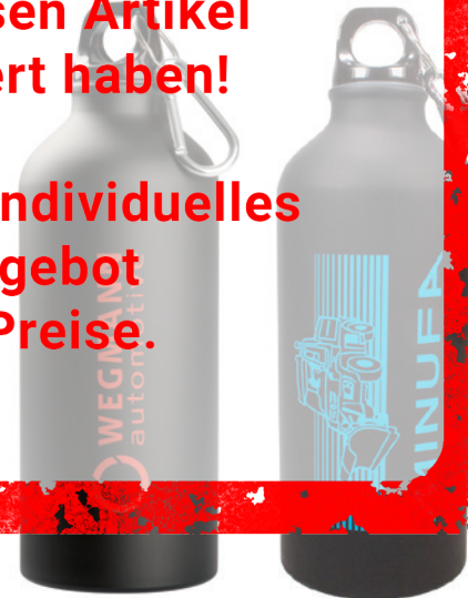
Beispiel Lasergravur auf schwarzer Flasche, Unterlack rot bzw. blau

Gerne erstellen wir Ihnen ein individuelles und unverbindliches Angebot auf Basis der aktuellen Preise.