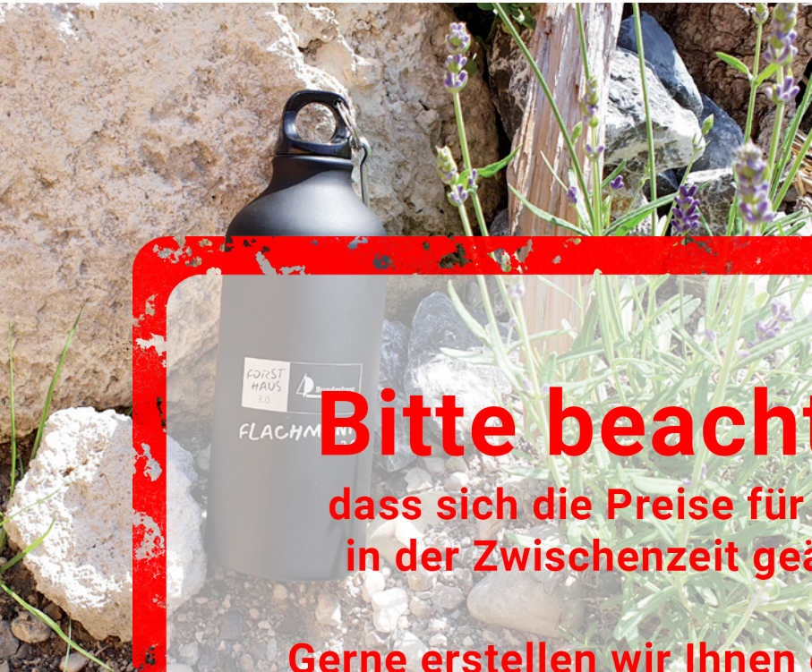
Beispiel Lasergravur Flasche matt schwarz, Unterlack weiß

Robuste, hochwertige Flasche für Outdoor, Sport und Freizeit: Sportflasche aus Aluminium mit dichtem Schraubverschluss (Silikonring) und Schlüsselring mit Karabinerhaken. Der farbige Unterlack und der mattschwarze Oberlack, der bei der Lasergravur entfernt wird, macht Ihr Logo auffällig und deutlich sichtbar. Der Unterlack ist in vier verschiedenen Farben erhältlich.