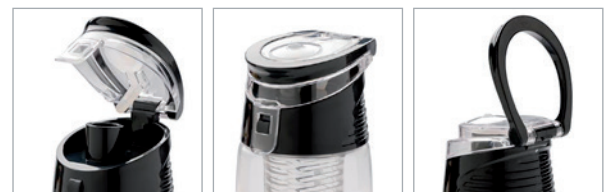
Mit sicherem Verschlusssystem und integriertem Henkel zum Tragen