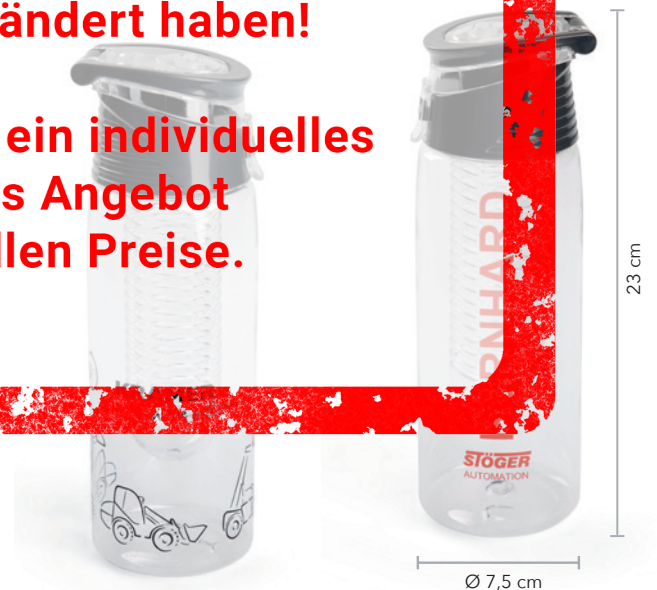
Beispiel 360° Rundumdigitaldruck

Angebot freibleibend, Preise zzgl. MwSt. ab Werk, Irrtümer vorbehalten. Bitte senden Sie uns Ihre druckfähigen PDF- oder EPS-Daten inklusive Pantone Farbangaben zu.