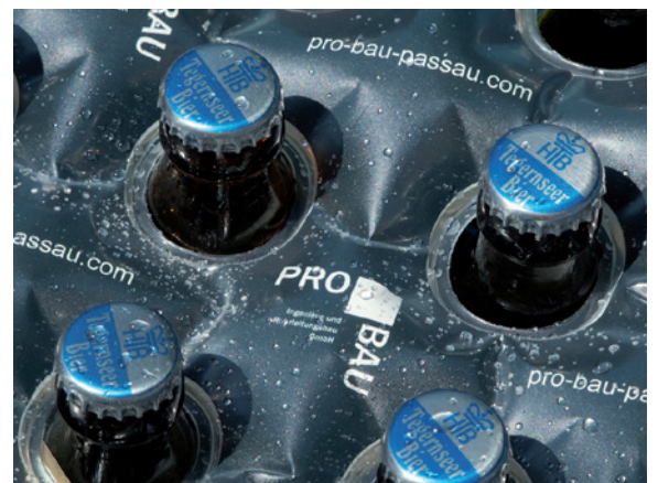
Beispiel fotorealistischer Digitaldruck

Bitte aktuelle Tagespreise anfragen. Aufgrund der stark schwankenden Rohstoffpreise sind die angegebenen Preise nur Richtpreise.