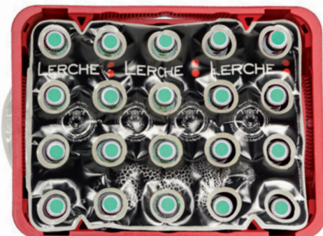
Beispiel Digitaldruck, 20 x 0,5l Flaschen