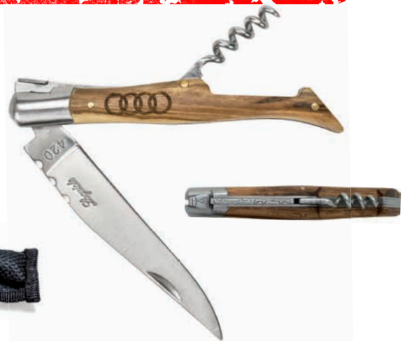
DUB092 ohne Korkenzieher inklusive Nylonetui, Beispiele Lasergravur auf Griff und Klinge