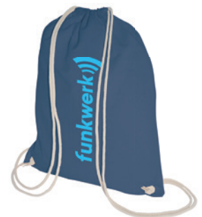
Modell 2810-F, farbig