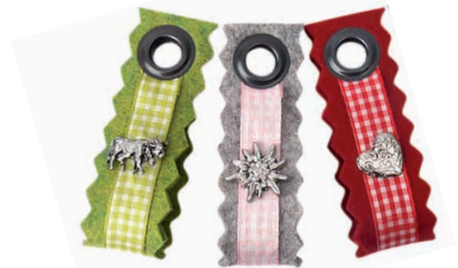
Maßkrugbandl Madl mit verschiedenen Charms gegen Aufpreis