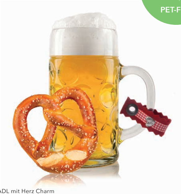
Maßkrugbandl MADL mit Herz Charm