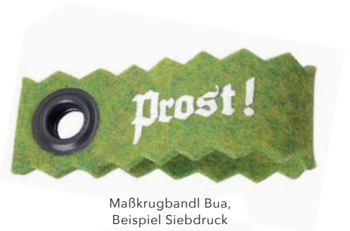
Maßkrugbandl Bua, Beispiel Siebdruck