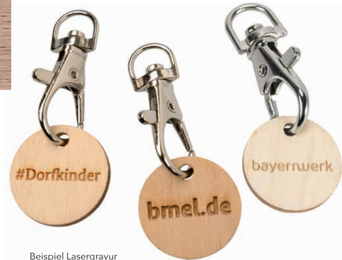
Beispiel Lasergravur und Karabinerhaken

Nachhaltiger Einkaufswagen-Chip „Green Coin“ aus FSC-zertifiziertem Birkenholz. Per Lasergravur oder per Druck einseitig individualisierbar. Auf der Rückseite mit gelasertem FSC-Logo. Auf Anfrage auch beidseitig bedruckbar. Verschiedene Präsentationsmöglichkeiten: Karabinerhaken, bedrucktes Klappkärtchen oder im bedruckbaren Öko-Beutel. Geeignet für alle gängigen Einkaufswagen-systeme. Mögliches Zubehör (gegen Aufpreis): Bedruckbares Klappkärtchen, Bedruckbarer Öko-Beutel, Motiv/Form der Münze