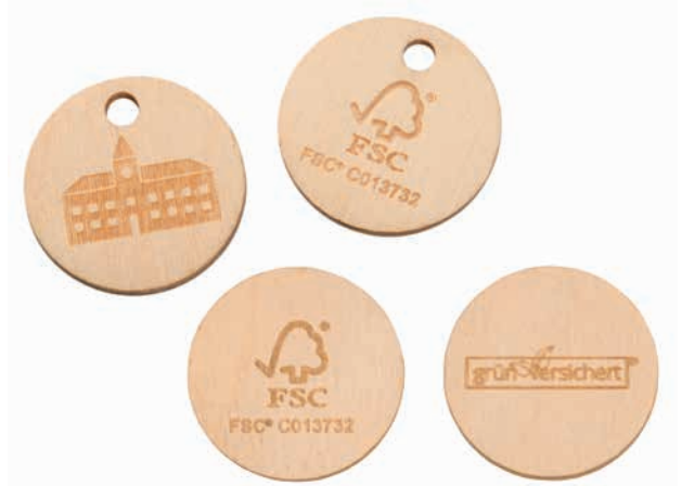
Green Coin mit oder ohne Bohrung Beispiel Lasergravur

Lieferzeit: ca. 3-4 Wochen nach Produktionsfreigabe | Fixtermin? Fragen Sie nach unserem Express-Service!