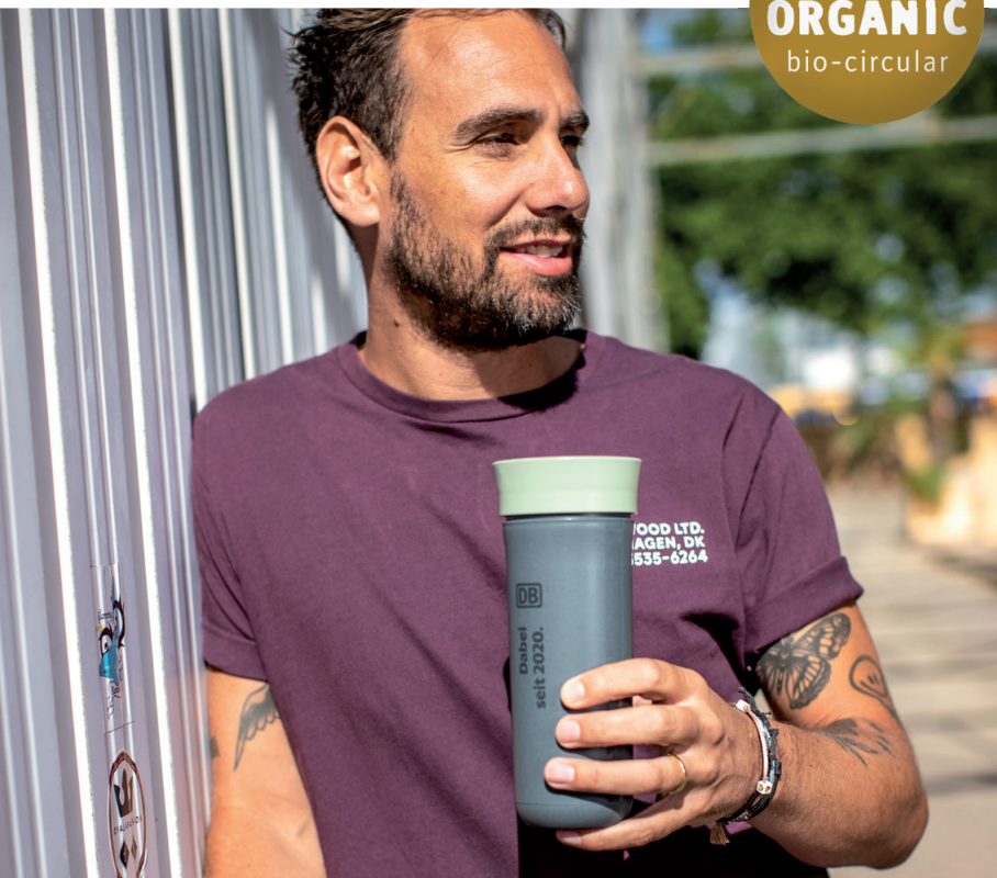
Thermobecher SAFE TO GO 700 ml, Beispiel 1-farbiger Tampondruck

koziol Made in Germany ORGANIC bio-circular