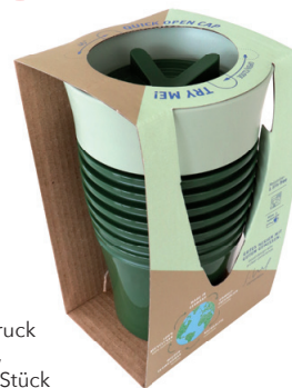
SAFE TO GO Small, Beispiel Druck Einzelverpackung mit Banderole, Becher in Sonderfarbe ab 500 Stück