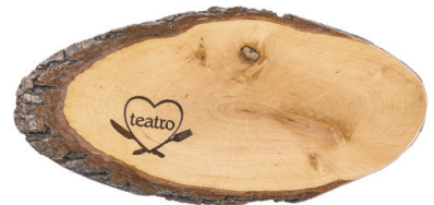
Rindenscheibe 27-32 cm, geölt, Beispiel Brandstempel

Unser Produkt online: « Bitte hier scannen!