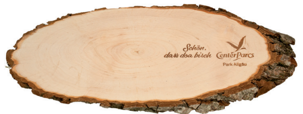
Rindenscheibe 40-46 cm, ungeölt, Beispiel Lasergravur