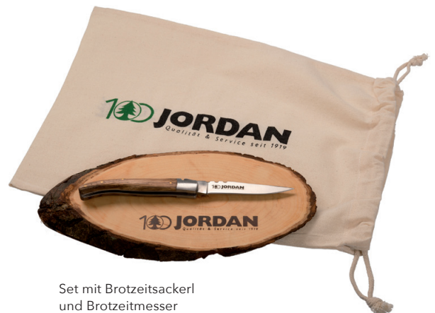
Set mit Brotzeitsackerl und Brotzeitmesser

Lieferzeit: ca. 2 Wochen nach Produktionsfreigabe | Fixtermin? Fragen Sie nach unserem Express-Service!