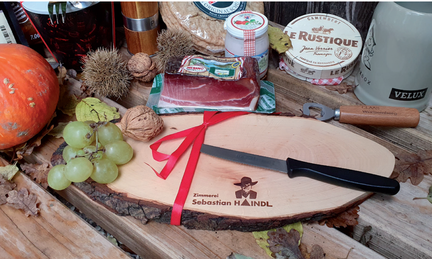
Rindenscheibe geölt, 40 - 46 cm, Beispiel Brandstempel