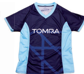
Damen-Shirt mit Kugelarm und V-Ausschnitt

Lieferzeit: ca. 2 Wochen nach Produktionsfreigabe | Fixtermin? Fragen Sie nach unserem Express-Service!