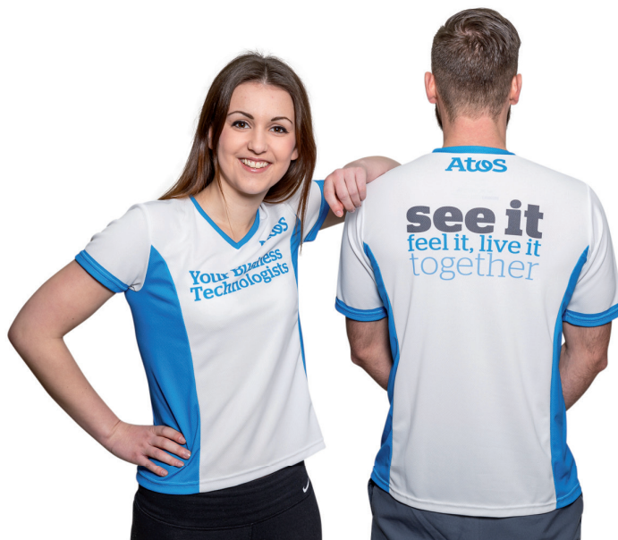
Damen-Shirt mit V-Ausschnitt, Herren-Shirt mit Rundhals-Ausschnitt, Beispiel Allover-Sublimationsdruck

Damen- oder Herren-Laufshirt mit individuellem, vollflächigem 4-farbigem Sublimationsdruck. Das Shirt ist erhältlich in Kugelarm- oder Raglanarm-Schnitt sowie mit Rundhals oder V-Ausschnitt. COOL PLUS ist ein Funktionsmaterial für höchste Ansprüche: es wirkt direkt auf der Faser-oberfläche und nicht auf der Haut. So hemmt es die mikrobielle Geruchs-entwicklung in Textilien und ist auf Körperverträglichkeit getestet.