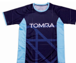
Herren-Shirt mit Raglanarm und Rundhals-Ausschnitt