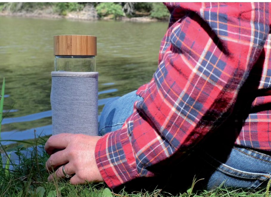
Glasflasche Ocha doppelwandig 400 ml

Die Trinkflaschen OCHA und REISUI sind mit einem schicken Bambus-Schraubverschluss sowie einer Silikondichtung versehen. Durch die graue Neopren-Hülle ist die Flasche gut geschützt. REISUI bieten wir als einwandige 500 ml Isolierglasflasche an und OCHA ist erhältlich als doppelwandige 400 ml Isolierglasflasche. Mit einer Lasergravur kann Ihr Logo oder Slogan gut sichtbar angebracht werden. Tun Sie etwas Gutes für unsere Umwelt und vermeiden Sie mit dieser Flasche den Gebrauch von Wegwerf-Trinkflaschen.