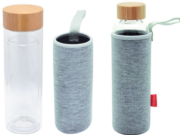
Glasflasche Ocha doppelwandig, 400 ml