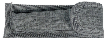
Mit nachhaltigem Etui aus rPET