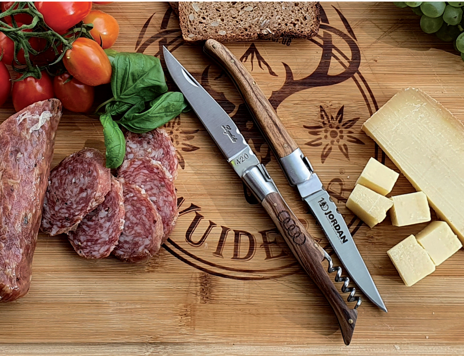
Taschenmesser TRADITION, Beispiel Lasergravur auf dem Griff oder auf der Klinge

Das Taschenmesser TRADITION ist in zwei verschiedenen Ausführungen erhältlich: mit und ohne Korkenzieher. Der Griff des Messers besteht aus massivem Zebranoholz und die Klinge aus rostfreiem Edelstahl. Das Messer ist ideal in der Gastronomie oder auch bei Outdooraktivitäten einsetzbar. Die Werbeanbringung erfolgt als hochwertige Lasergravur. Die Messer werden im Nylonetui geliefert.