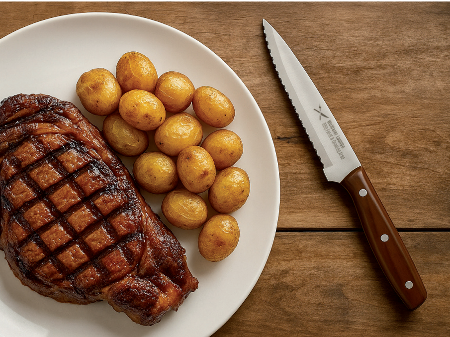
Steakmesser MILANO, Beispiel Lasergravur