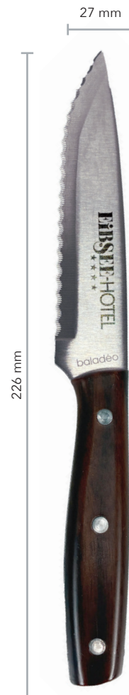
Steakmesser MILANO, Beispiel Lasergravur

Unser Produkt online: << Bitte hier scannen!