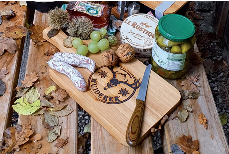
Bambusbrett mit Griff und Aufhängeloch, Beispiel Brandstempel