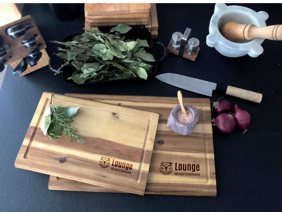
Schneidebretter aus FSC-zertifiziertem Akazienholz in zwei Größen, Beispiel Lasergravur