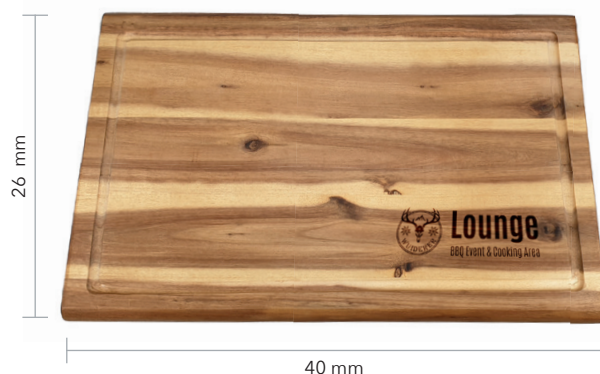
Großes Schneidebrett, Beispiel Einbrand