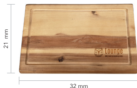
Kleines Schneidebrett, Beispiel Lasergravur

Unser Produkt online: « Bitte hier scannen!