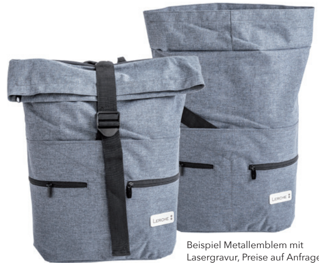
Beispiel Metallemblem mit Lasergravur, Preise auf Anfrage