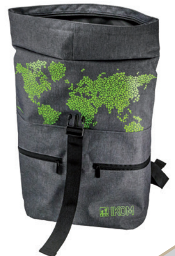
Vollflächiger Druck (Sonderanfertigung ab 1000 Stück)

Lieferzeit: ca. 4 Wochen nach Produktionsfreigabe | Fixtermin? Fragen Sie nach unserem Express-Service! Angebot freibleibend, Preise zzgl. MwSt. ab Werk, Irrtümer vorbehalten. Bitte senden Sie uns Ihre druckfähigen PDF- oder EPS-Daten inklusive Pantone Farbangaben zu.