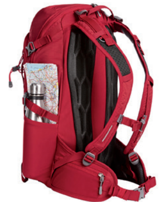
Innovatives Wabensystem zur Belüftung