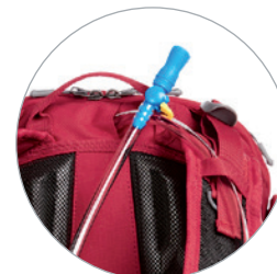
Ausgang für Schlauch des Trinksystems