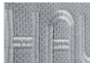
Shopper MONO, Beispiel Stick