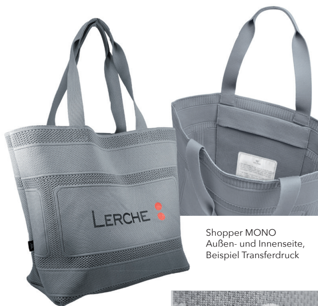
Shopper MONO Außen- und Innenseite, Beispiel Transferdruck