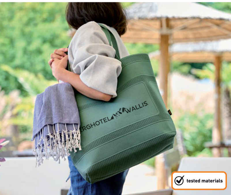
Shopper MONO in hellgrün, Beispiel Druck