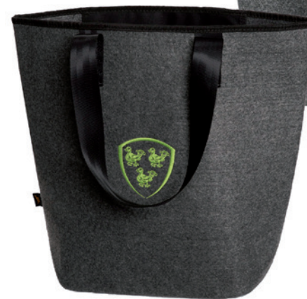
Beispiele mit Stick

Angebot freibleibend, Preise zzgl. MwSt. ab Werk, Irrtümer vorbehalten. Bitte senden Sie uns Ihre druckfähigen PDF- oder EPS-Daten inklusive Pantone Farbangaben zu.