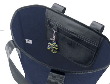
Mit Innentasche für Wertsachen