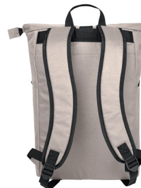
Gepolsterte Tragegurte und extra Handgriff