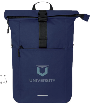
Beispiel Siebdruck 2-farbig (auf Anfrage)