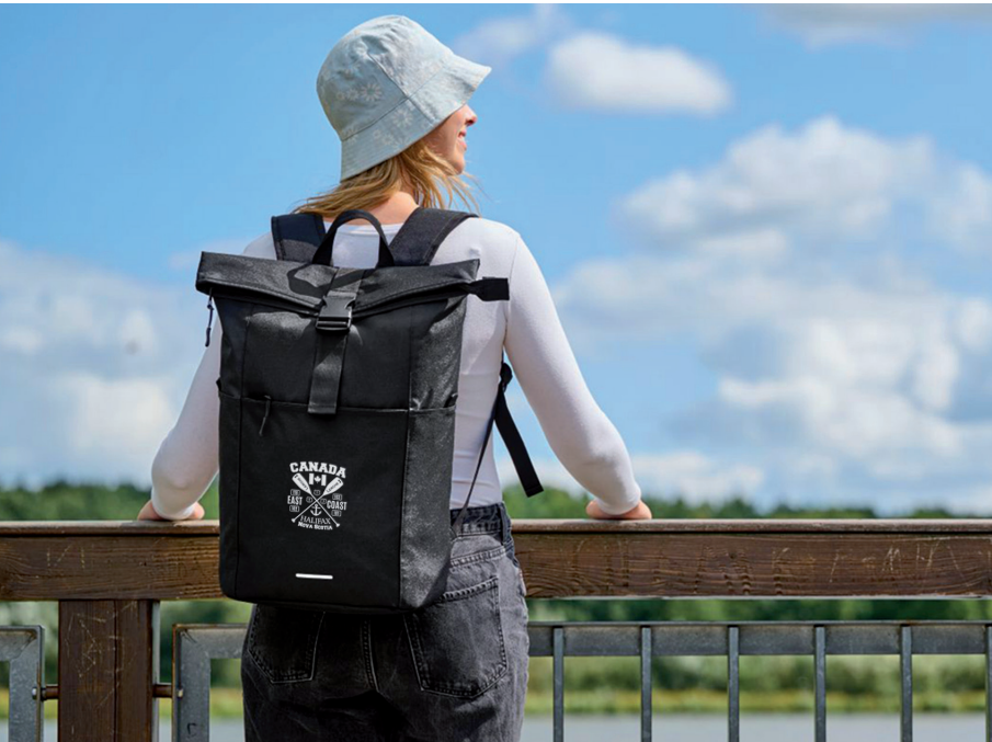
Rucksack BASIC, Beispiel Stick